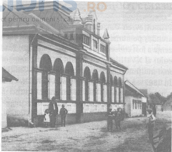
Berettyóújfalu, școala și casa de rugăciuni