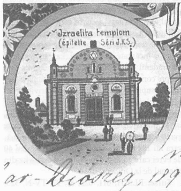
Diosig, sinagoga ortodoxă

Este una dintre localitățile unde evreii s-au stabilit de timpuriu, încă din veacul al XVIII-lea. De-a lungul timpului populația evreiască a sporit, în